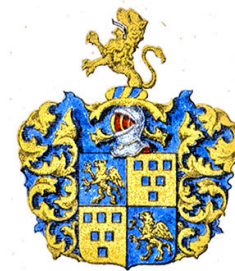
Vapensköld för adliga ätten nr 1087 Tigerschiöld

I går kväll läste jag av en händelse en uppsats i Södermanlands museums årsbok 1981 om Selma Lagerlöf och hennes anknytning till Sörmland. Där sägs att förebilden till den elaka Sintram i Gösta Berlings saga skulle vara en godsägare i Sörmland som döpt en tjur på sin gård till Kronprinsen och sedan ordat vitt och brett om att han skulle skjuta kronprinsen. Missförstånd uppstod om vilken kronprins, han häktades och hängde sig i häktet.