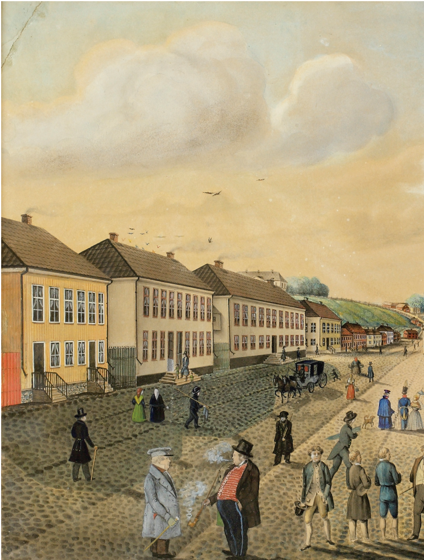
Konstverk ur Smålands museums samlingar, Växjö