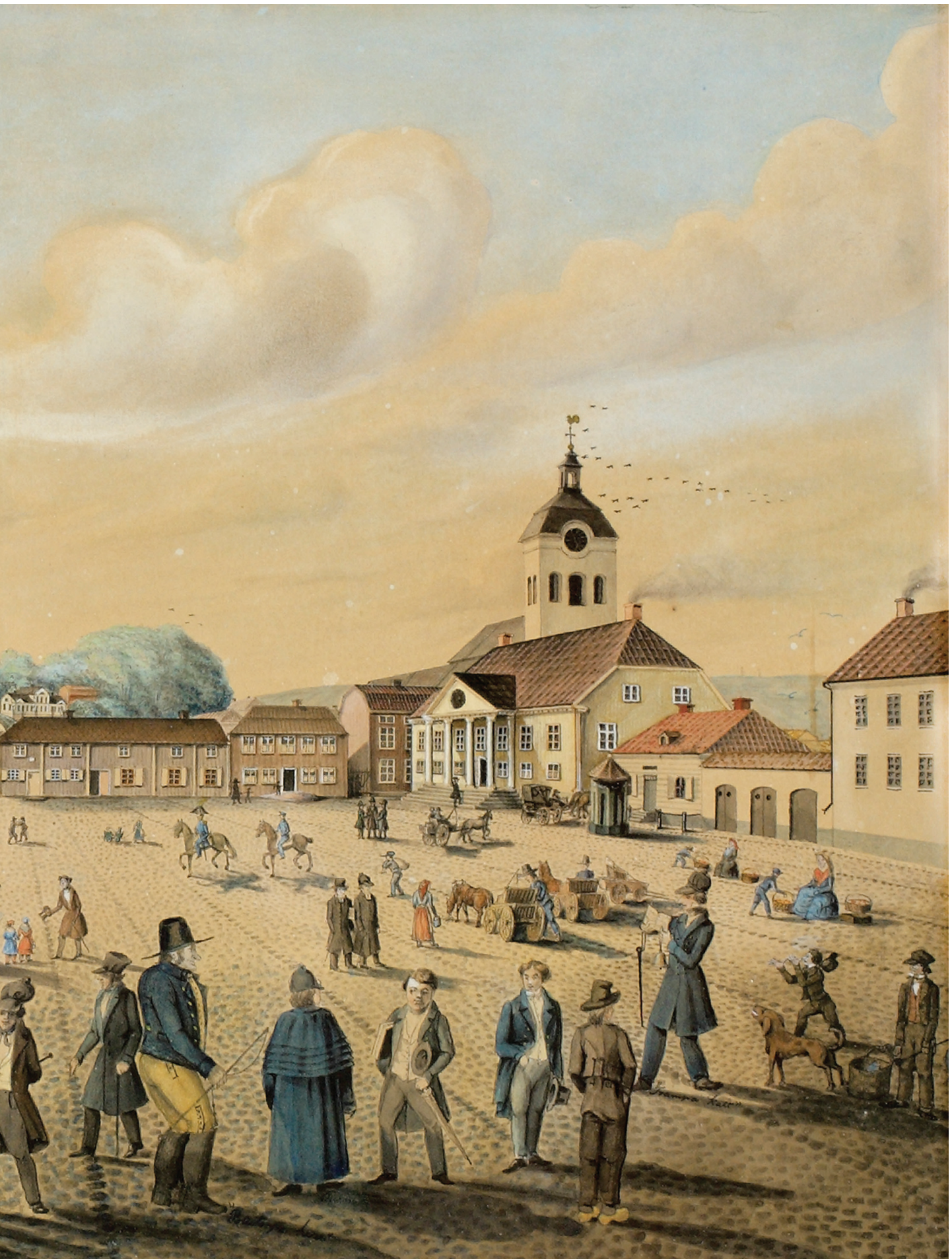
1837 – året före den stora branden