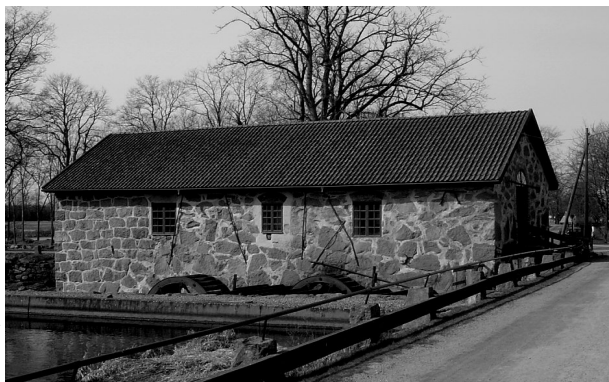
Bilden tagen vid Huseby bruk